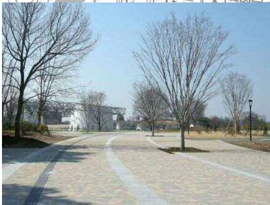
高松口ゲート付近から公園内を望む